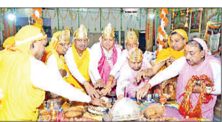
रोहतक।—पूजा अर्चना करते भक्तजन।