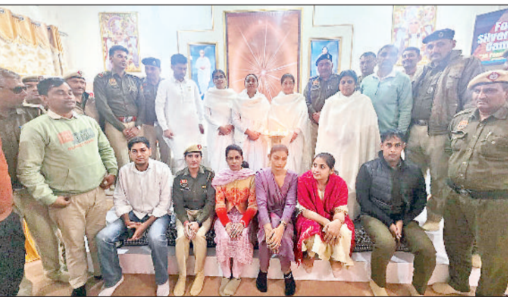
महम। आध्यात्मिक कार्यक्रम में भाग लेते पुलिसकर्मियों व साथ मौजूद ब्रह्माकुमारीज बहनें।