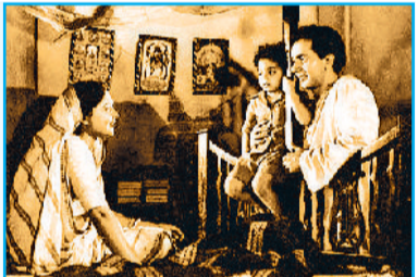
बिमल राय की यथार्थपरक फिल्म 'दो बीघा जमीन'