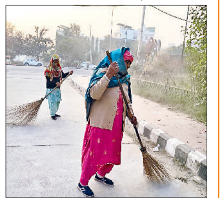
रोहतक। सफाई करते कर्मचारी।

रोहतक। शहर को स्वच्छ, स्वस्थ और व्यवस्थित बनाने के लिए नगर निगम स्वच्छता लगातार फील्ड में सक्रिय है। निगम की टीमें प्रतिदिन विभिन्न मुख्य मार्गों, बाजारों तथा सार्वजनिक स्थानों पर सफाई अभियानों का निगरानी कर रही हैं और गंदगी फैलाने वालों के विरुद्ध सख्त कार्रवाई की जा रही है। शनिवार निगम टीम द्वारा शहर के मुख्य मार्गों एवं राजीव गांधी स्टेडियम परिसर में विशेष सफाई अभियान चलाया गया। निरीक्षण के दौरान पाया गया कि कुछ स्थानों पर दुकानदारों एवं राहगीरों द्वारा निर्धारित स्थानों के अतिरिक्त खुले में कूड़ा फेंका जा रहा था, जिससे आसपास गंदगी की स्थिति उत्पन्न हो रही थी। नियमों का उल्लंघन पाए जाने पर मौके पर ही संबंधित व्यक्तियों से सफाई करवाई करवाई गई तथा भविष्य में गंदगी न फैलाने की चेतावनी देते हुए चालान भी किया गया। निगम द्वारा प्रतिदिन गंदगी फैलाने वालों, डस्टबिन न रखने वालों तथा सड़क पर कचरा डालने वाले व्यक्तियों के विरुद्ध कार्रवाई की जा रही है। टीमों को निर्देश दिए गए हैं कि जहां भी कूड़ा अनियमित रूप से पाया जाए, वहां तुरंत सफाई करवाकर संबंधित दौड़ियों पर चालान किया जाए। निगम का उद्देश्य शहर में कूड़े के ढेरों को कम करना, स्वच्छता व्यवस्था को मजबूत करना तथा नागरिकों में साफ-सफाई के प्रति जागरूकता बढ़ाना है। नगर निगम ने सभी नागरिकों, दुकानदारों एवं संस्थाओं से अपील की है कि वे निर्धारित डस्टबिन का उपयोग करें, कूड़ा सड़क पर न फेंकें और स्वच्छता बनाए रखने में निगम का सहयोग करें। निगम टीमों द्वारा गंदगी फैलाने वालों पर आगे भी इसी प्रकार सख्त कार्रवाई जारी रहेगी।