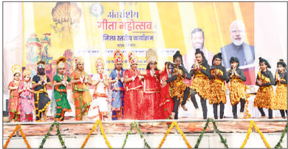
रोहतक। जिला स्तरीय कार्यक्रम में अपनी प्रस्तुति देते प्रतिभागी।