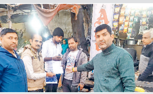
रोहतक। पावर हाउस चौक क्षेत्र में नगर निगम की टीम कार्रवाई करती हुई

नगर निगम अधिकारियों ने बताया कि शहर को स्वच्छ और व्यवस्थित रखने के उद्देश्य से नियमित रूप से ऐसे निरीक्षण अभियान चलाए जा रहे हैं। उन्होंने स्पष्ट कहा कि सार्वजनिक स्थानों पर कचरा फेंकने, गंदगी फैलाने या सफाई व्यवस्था में बाधा डालने वालों के खिलाफ भविष्य में भी इसी प्रकार की कठोर कार्रवाई जारी रहेगी। निगम का मानना है कि नागरिकों की छोटी-सी लापरवाही भी शहर की समग्र स्वच्छता व्यवस्था पर प्रतिकूल प्रभाव डालती है। इसलिए आवश्यक है कि सभी निवासी अपनी जिम्मेदारी को समझें और कचरा केवल निर्धारित डस्टबिन या निगम द्वारा तय किए गए स्थानों पर ही डालें।