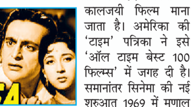
कालजयी फिल्म माना जाता है। अमेरिका की 'टाइम' पत्रिका ने इसे 'ऑल टाइम बेस्ट 100 फिल्म' में जगह दी है। समानांतर सिनेमा की नई शुरुआत 1969 में मृगाल सेन की फिल्म 'धुवन सोम' से माना जाता है। ऐसे ही श्याम बेनेगल 1973 में 'अंकुर' बनाकर समानांतर सिनेमा के नवसूत्र के प्रमुख हस्ताक्षर बने। सन 1976 में मृगाल सेन ने 'मृगया' बनाई, जो मिथुन चक्रवर्ती की पहली फिल्म थी। श्याम बेनेगल की फिल्म 'अंकुर', 'मंथन' और 'भूमिका', मणि कौल की 'उसकी रोटी' और 'दुविधा'। सत्यजीत रे की 'पाथेर पांचाली', 'शतरंज के खिलाड़ी', 'सद्गति'। इन सभी फिल्म मेकर्स का समानांतर सिनेमा को समृद्ध करने में महत्वपूर्ण योगदान रहा है। *

के सभी पक्षों को शामिल किया जाए, तो ही समानांतर सिनेमा को यथार्थवादी सिनेमा कहना ज्यादा उचित होगा। यदि इसमें 'अंकुर' जैसी फिल्म शामिल हो तो 'हम साथ साथ हैं' को भी शामिल किया जा सकता है। इन फिल्मकारों का रहा बड़ा योगदान: समानांतर और यथार्थपरक फिल्मों की बात करें, तो इस परंपरा को समृद्ध करने में कई फिल्मकारों का बेहद महत्वपूर्ण योगदान रहा है। 1953 में आई बिमल राय की 'दो बीघा जमीन' ने समीक्षकों की प्रशंसा के साथ व्यावसायिक सफलता प्राप्त की थी। इसके बाद बिमल राय ने 'बिराज बहू', 'देवदास', 'सुजाता' और 'बंदिनी' जैसी यथार्थपरक फिल्में बनाईं। ऐसी फिल्में बनाने वाले फिल्मकारों में गुरुदत्त भी थे। उनकी फिल्म 'प्यासा' को हिंदी सिनेमा की कालजयी फिल्म माना जाता है। अमेरिका की 'टाइम' पत्रिका ने इसे 'ऑल टाइम बेस्ट 100 फिल्म' में जगह दी है। समानांतर सिनेमा की नई शुरुआत 1969 में मृगाल सेन की फिल्म 'धुवन सोम' से माना जाता है। ऐसे ही श्याम बेनेगल 1973 में 'अंकुर' बनाकर समानांतर सिनेमा के नवसूत्र के प्रमुख हस्ताक्षर बने। सन 1976 में मृगाल सेन ने 'मृगया' बनाई, जो मिथुन चक्रवर्ती की पहली फिल्म थी। श्याम बेनेगल की फिल्म 'अंकुर', 'मंथन' और 'भूमिका', मणि कौल की 'उसकी रोटी' और 'दुविधा'। सत्यजीत रे की 'पाथेर पांचाली', 'शतरंज के खिलाड़ी', 'सद्गति'। इन सभी फिल्म मेकर्स का समानांतर सिनेमा को समृद्ध करने में महत्वपूर्ण योगदान रहा है। *