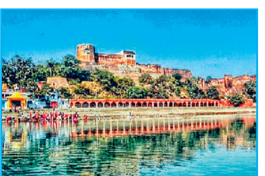
अखनूर फोर्ट के पास से प्रवाहमान तवी नदी

किनारे पनपते हैं और इसको समृद्ध वनस्पति स्थल बनाते हैं। इसी तरह तवी घाटी में हिमालयी लंगूर, पहाड़ी लोमड़ी, जंगली बिल्ली और काला भालू जैसे जीव जंतु भी पाए जाते हैं। इनके अलावा यहां किंग फिशर, उल्लू, बगुले, पहाड़ी गौरैया जैसे पक्षी इसकी जैव विविधता की गाथा कहते हैं। इसी में ट्राउट, महाशीर और क्रॉप जैसी मछलियों की भी उपस्थिति इसे खास बनाती है। कई तरह से है उपयोगी: तवी का तेज प्रवाह इसका पथरीला तल इसे देश की दूसरी नदियों की अपेक्षा बेहद स्वच्छ रखता है। यह चिनाब की प्रमुख सहायक नदी है और सिंधु प्रणाली में जल उपलब्धता बढ़ाने पर अपना योगदान देती है। इसके तलों पर उगने वाली घास और वृक्ष, नदी के कटाव को रोकते हैं और जैविक स्थिरता बनाए रखते हैं। शहर के मध्य से गुजरते समय इसका घुमावदार प्रवाह बहुत आकर्षक लगता है। यह जम्मू शहर के पेय जल की प्रमुख स्रोत है। साथ ही इससे जम्मू, उधमपुर और अखनूर जिलों की कृषि भूमि सिंचित होती है। चुनौतियां हैं कई: हर नदी की तरह तवी के भी कुछ संकट हैं, जैसे शहर का बढ़ने वाला नाला, कचरा और सीवेज इसे बीमार बनाता है। अवैध रेन खनन इसे घायल करता है और शहरीकरण का बढ़ता बोझ इसके विस्तार को छीनता जा रहा है, जो इसके जलस्तर में कमी का प्रमुख कारण बनता है। तवी महज एक नदी नहीं बल्कि जम्मू की सांस्कृतिक, भौगोलिक और ऐतिहासिक धरोहर है। इसे इतिहास की धड़कन और संस्कृति की आत्मा कहते हैं। जम्मू शहर की इस पहचान को संरक्षित किया जाना बहुत आवश्यक है। *