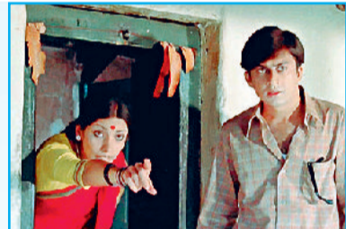
श्याम बेनेगल की 'अंकुर' में दिखा जीवन यथार्थ

दिखता है जीवन का यथार्थ: समानांतर सिनेमा में जीवन और समाज का यथार्थ बहुत गहराई से दिखाया जाता रहा है। यह हिंदी सिनेमा का वह पक्ष है, जिसमें आम आदमी के जीवन की जद्दोजहद, सामाजिक असमानता और बदलाव को दर्शाया जाता है। फिल्मों के कथानक में यथार्थ को पूरी शिद्दत के साथ प्रस्तुत करने का यह चलन 1950 के दशक में पश्चिम बंगाल से शुरू हुआ और बाद में इसे हिंदी समेत हर भाषा के सिनेमा में अपनाया। इसका मकसद जीवन के