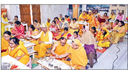
रोहतक। पूजा अर्चना करते भक्तजन।