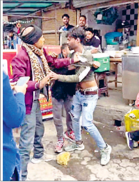
हरिभूमि न्यूज ▶▶ रोहतक

गोहाना अड्डे पर एक महिला के पीछे पड़ने और मोबाइल नंबर मांगने वाले युवक की स्थानीय लोगों ने सरेआम जमकर पिटाई कर दी। महिला बाजार में कपड़े खरीदने आई थी, तभी आरोपी युवक ने उसका पीछा करना शुरू कर दिया और लगातार मोबाइल नंबर मांगता रहा। महिला ने शुरू में युवक की बातों को नजरअंदाज किया, लेकिन जब उसने आपत्तिजनक बातें शुरू की, तो महिला ने विरोध किया और शोर मचाया। महिला की चीख-पुकार सुनकर आसपास के लोग मौके पर इकट्ठा हो गए और युवक को पकड़कर उसकी पिटाई करने लगे। घटना का एक वीडियो सोशल मीडिया पर तेजी से वायरल हो गया है, जिसमें साफ देखा जा सकता है कि महिला और स्थानीय लोग आरोपी की पिटाई कर रहे हैं। इस दौरान युवक हाथ जोड़कर माफी मांगता नजर आया, लेकिन लोगों ने उसकी बातों को अनसुना कर पिटाई जारी रखी।